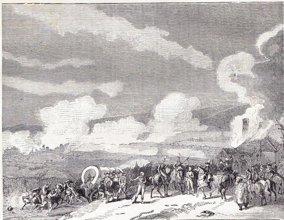
Bataille de Marengo.

annoncé pour le 2 décembre. Napoléon, pour étonner la France et le monde par une cérémonie imposante, voulut que le pape vint le sacrer lui-même à Notre-Dame de Paris. Pie VII fit les onctions saintes au front du nouveau Charlemagne ; mais quand il voulut prendre la couronne pour la lui poser sur la tête, le soldat autoritaire se retrouva, il la saisit et se couronna lui-même.