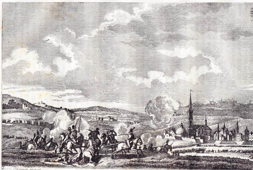
Bataille de Hohenlinden. (Fac-similé d'une estampe du temps.)

une entrevue à Napoléon, aux avant-postes; on convint d'un armistice, et le roi de Prusse se hâta de démentir tals à Austerlitz, pour qu'on vous réponde: Voilà un brave. » L'empereur d'Autriche avait demandé