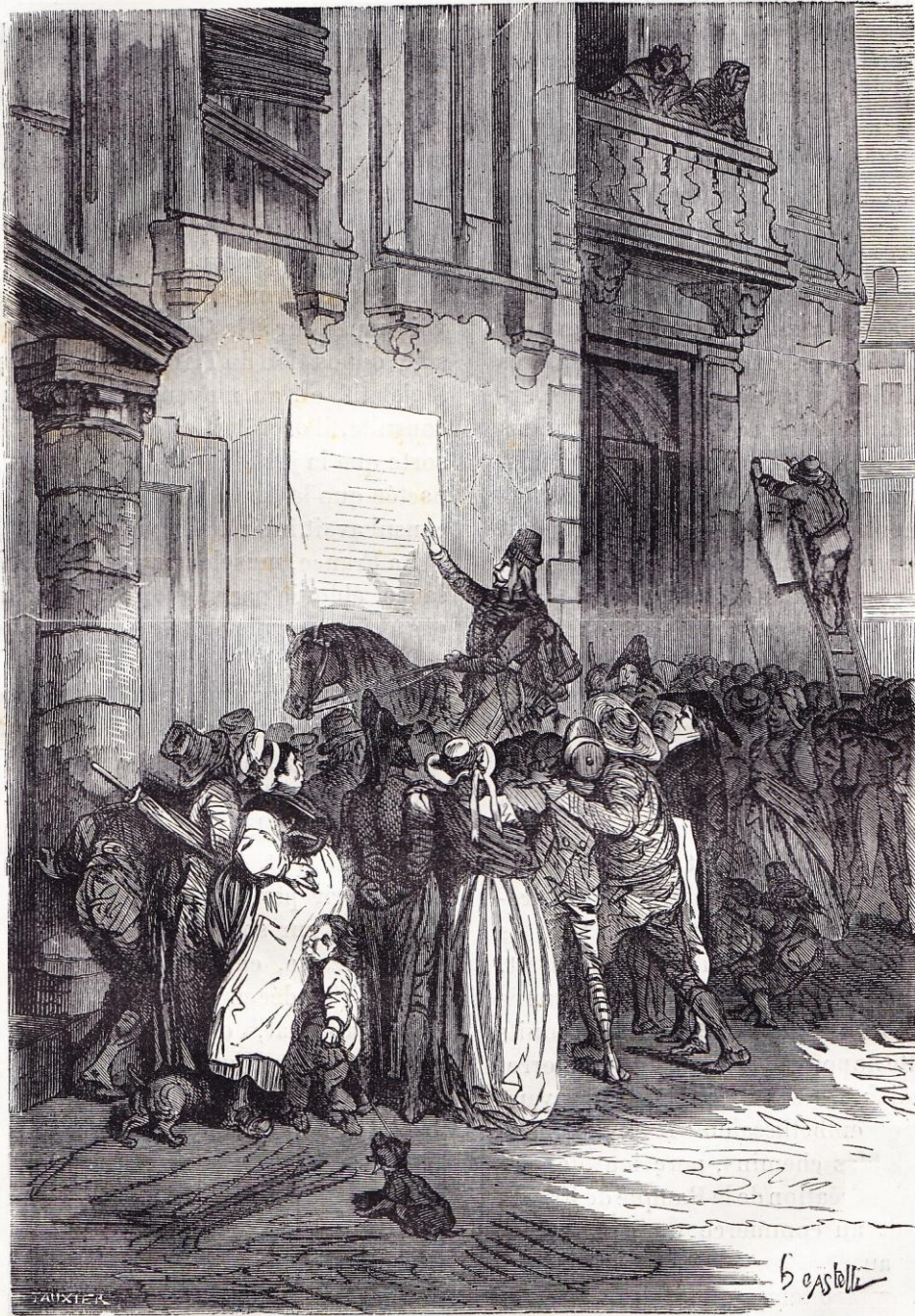
Journée du 18 brumaire.

se fit battre par eux à Canope (9 avril 1801), et fut obligé d'évacuer le Caire et Alexandrie. Le 2 septembre suivant,